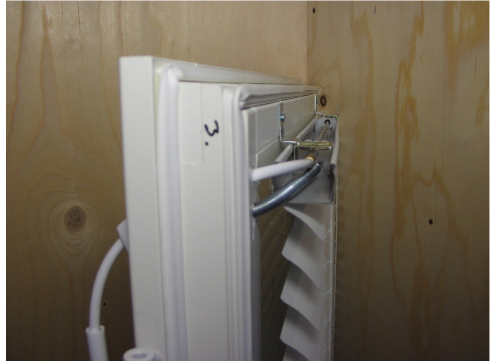
Sälekaihtinkomponentit, asennus ikkunoiden väliin, 19 x 27 mm yläkotelolle.